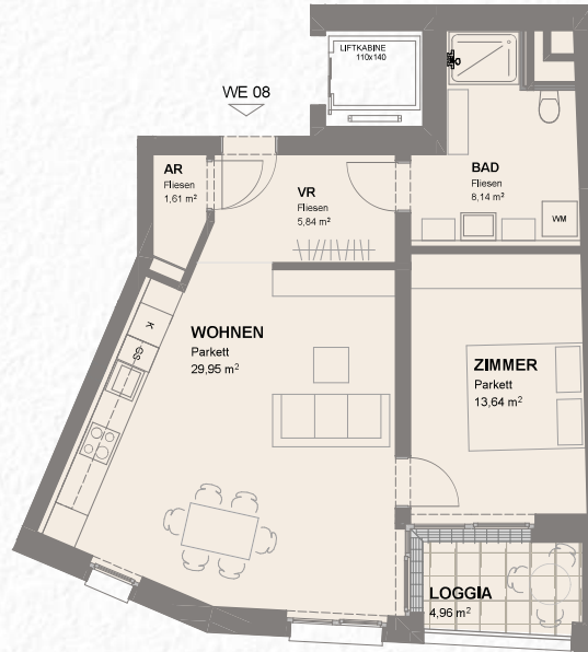
GRUNDRISS TOP 08 – 1:100