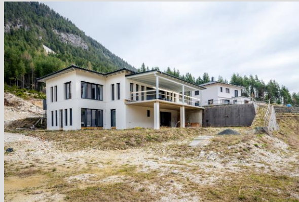
... die Südwestansicht