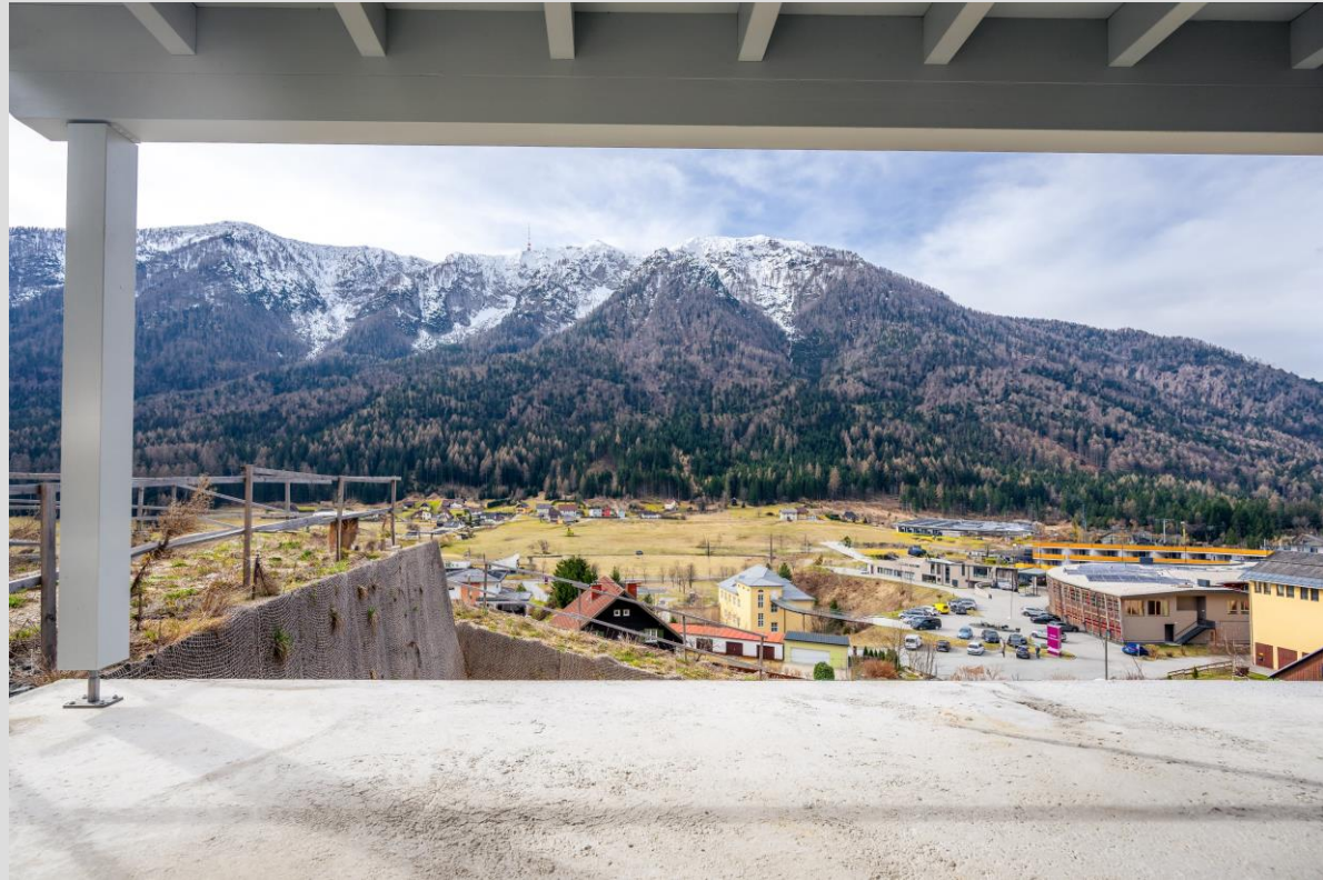
... der Außenpool