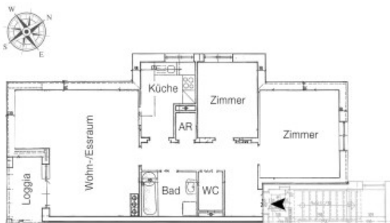
Plan Dachgeschoss Top 6