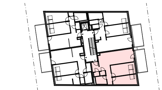
DONINGASSE ÜBERSICHT 1.DG