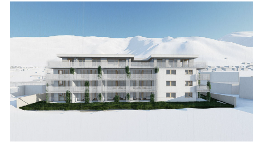
WA STEINA - Steinach am Brenner